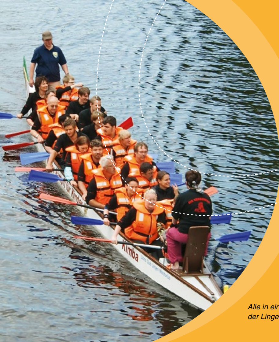
Alle in einem Boot: „Die Versenker – inklusives Drachenbootteam“ der Lingener Rudergesellschaft e. V., LinaS Lingen